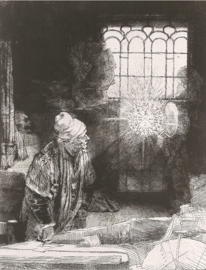
Rembrandt, Dr. Faustus, ets, droge naald en bu- rijn, staat I, Amsterdam Rijksprentenkabinet.

We zien op de ets een oude man, die voor een lessenaar staat. Met zijn rechterhand steunt hij op een tafel en met zijn linkerhand op de arMLEuning van een stoel, waaruit hij klaarblijkelijk juist is opgestaan. Vol aandacht kijkt de man naar links, naar een verschijning bij het raam, die bestaat uit een ronde schijf, met in het