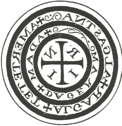
Amulet naar J. Reichelt, Exercitatio amuletis, Straatsburg 1676.

draagt zo'n amulet, zichtbaar in de opening van zijn mantel. In J. Reichelts: Exercitatio de amuletis vinden we de identiek tekst terug, die in het visioen verschijnt.